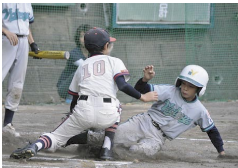
セーフ！ 平成 26年 11月 3日